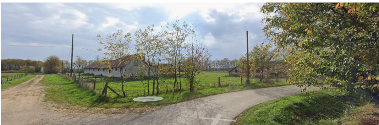
02026/2 hrsz-ú ingatlan látképe keletről