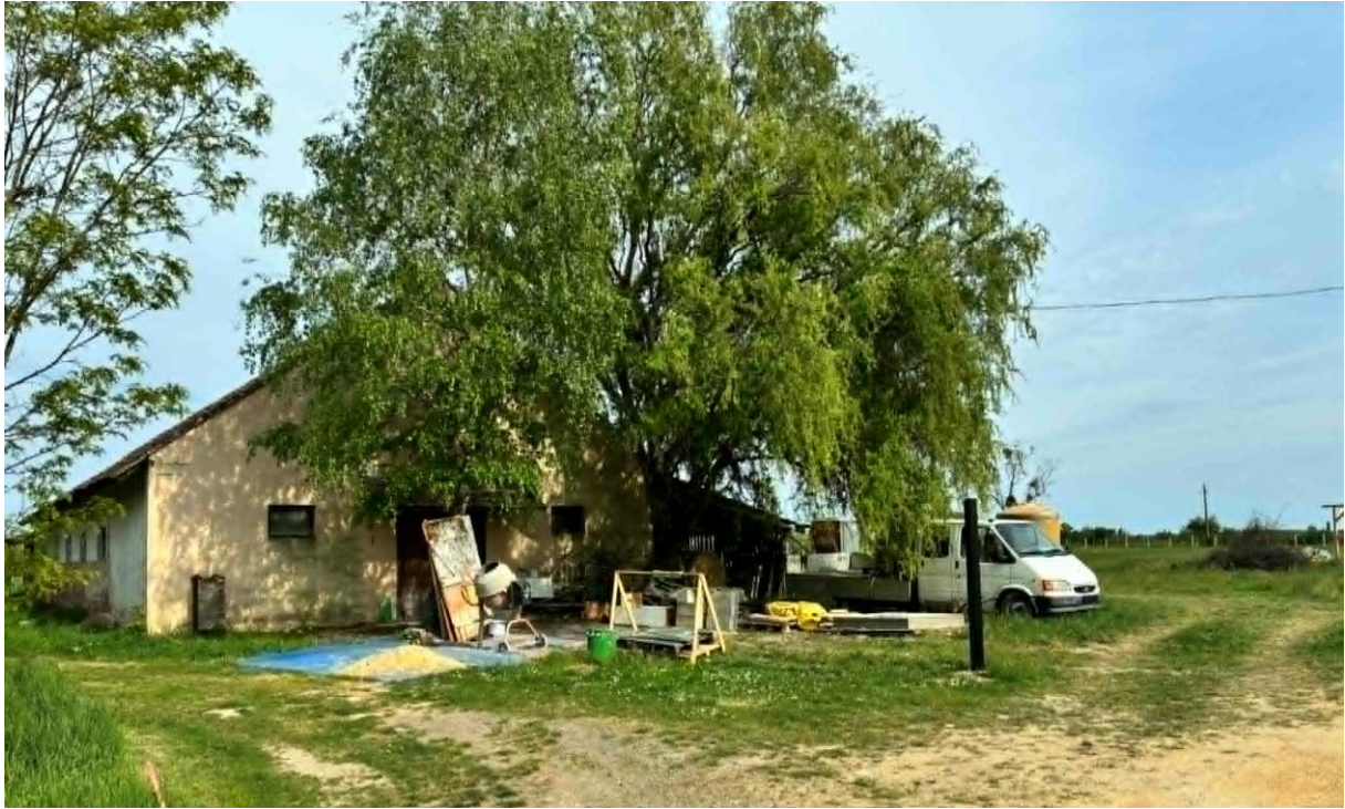
02022/1 hrsz-ú ingatlan látképe a közút felől