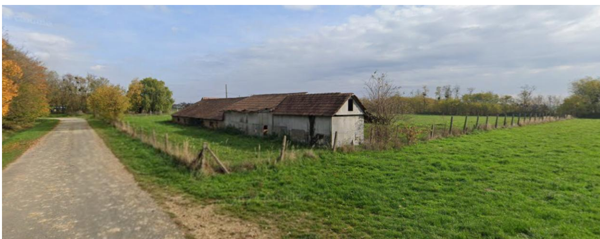
02026/2 hrsz-ú ingatlan látképe nyugatról (google maps, 2024. okt.)

A módosítás lényege a HÉSZ 3. mellékletében a Gá jelű építési övezetben az állattartási és állattenyésztési rendeltetés megengedése: