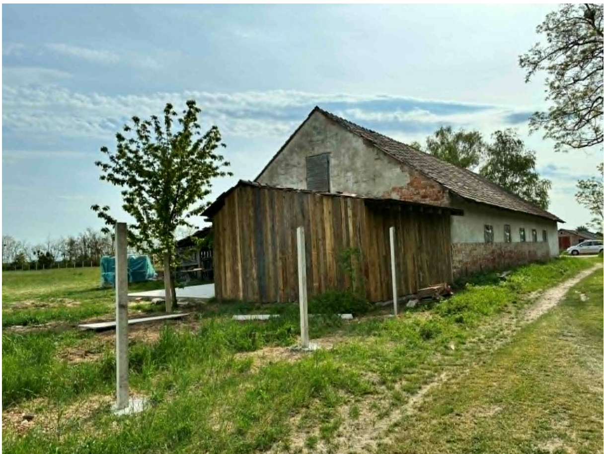
02022/1 hrsz-ú ingatlan látképe a telek észak-keleti határa felől