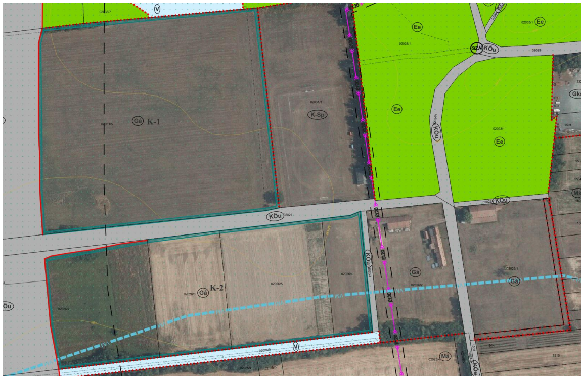
A Gá övezetek ortofotón

Az övezetben fekvő telkek közül csak kettő beépített, a többi telek felhasználása, beépítése nem kezdődött meg. A beépített telteken (02022/1 és 02026/2 hrsz) állattartó épületek találhatóak (korábbi kecskefarm, és méhészet).